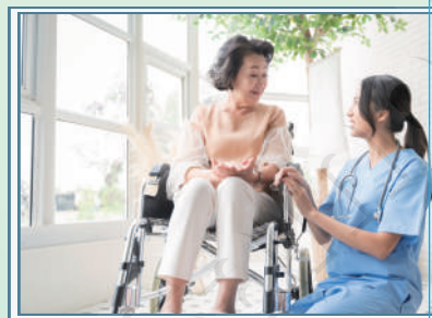
新潟県内の各地で実施しています