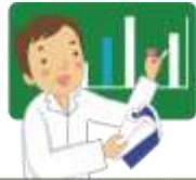
教職課程のある学科